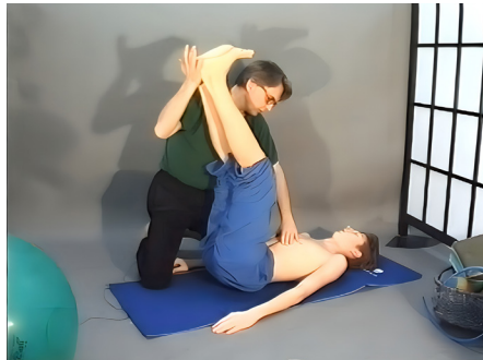
8 - Exercício geral em decúbito dorsal do tipo Mézières, com foco nos membros inferiores. Alongamento da cadeia posterior