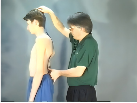
1 - Identificação da curvatura da coluna vertebral com régua de arquiteto. Vocabulário anatômico e fisiológico