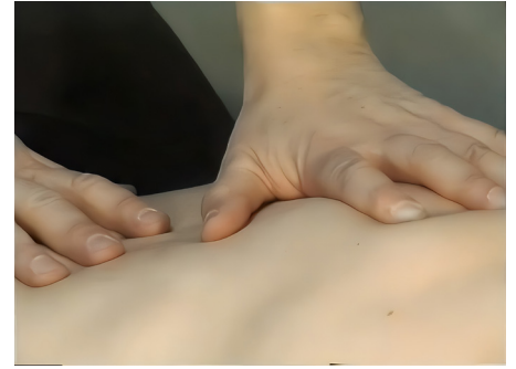
3 - Massagem analgésica Acoplamento vertebro-pulmonar com trabalho na expiração.