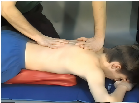
4 - Relaxamento analítico no ponto máximo da cifose em decúbito ventral. Estimulação das aferências proprioceptivas do sistema extrapiramidal