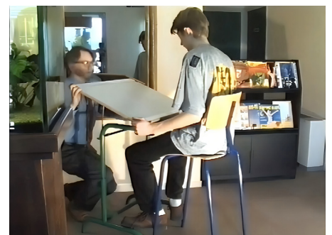
12 - Os 3S: Postura sentada na escola, Sono (evitar travesseiros) Esporte (evitar a postura sentada do remo...)