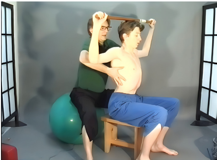
7 - Exercício de alongamento na posição sentada.